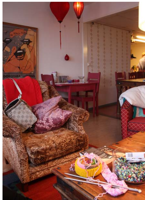
Enter Mötesplats vardagsrum inbjuder till samtal.

Sedan Stadsmissionens insamlingsansvarige anställdes 2009 avsattes mer tid åt att söka externa medel åt Enter. Detta gav positiva resultat vad gäller olika stimulerande tidsbegränsade projekt, exempelvis ridning på islandshästar under hösten samt simundervisning och ett kombinerat hälso- och matprojekt under 2010.