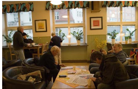
Besökare i Café David.

Den öppna verksamheten Café David är en gåvofinansierad verksamhet där Svenska kyrkan i Malmö är en av de största givarna. Verksamheten finansieras också av gåvor från privatpersoner, företag och stiftelser, samt Malmö Stads förenings- och organisationsbidrag och stöd till alternativt julfirande.