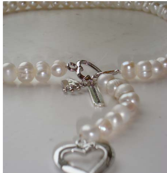
Stadsmissionshalsbandet tas varje år fram i samarbete med MarMalaid. Överskottet från försäljningen används i Stadsmissionens verksamheter.

började man strukturera upp insamlingsarbetet mer och tittade då bland annat på olika arbetssätt och strategier. Som en hjälp i detta arbete skrevs avtal med KomMed, ett internetbaserat insamlingsprogram som underlättar både kontakt med givare och administration av insamlade medel. Detta program sjsätts under 2010.