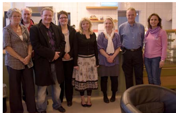
Delar av personalen, här i Café David.