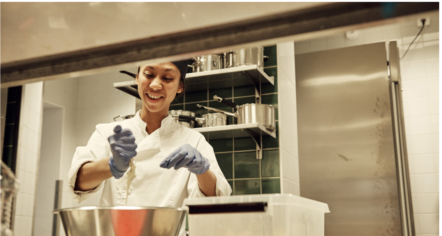
Matlagning på matsvinn i Stadsmissionens restaurang på Drottninggatan 33 i Göteborg.

På senare år har frågan fått ökad aktualitet i många välfärdsländer i efterdyningarna av den ekonomiska krisen 2008. Osäkerheten kring tillgången på mat, mätt i hur hushållen hade råd att hålla sig till rådande rekommendationer på området, ökade i Europa mellan åren 2008 till 2012 och ses nu som ett akut hälsoproblem, med betydelse för psykisk ohälsa, förmågan att hantera kronisk sjukdom och spädbarnsdödlighet. Den svenska situationen kring matfattigdom är alltså inte unik. Men att den drabbar ett land med så höga välfärdsambitioner som Sverige är anmärkningsvärt.